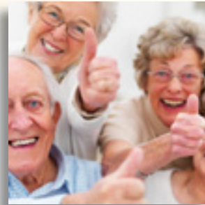
Akademie für Ältere