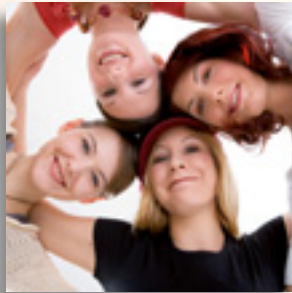
Kinder | Jugendliche