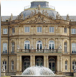
Forum | Kultur