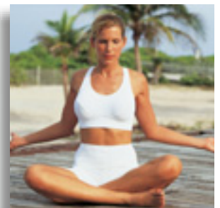
Gesundheit | Fitness